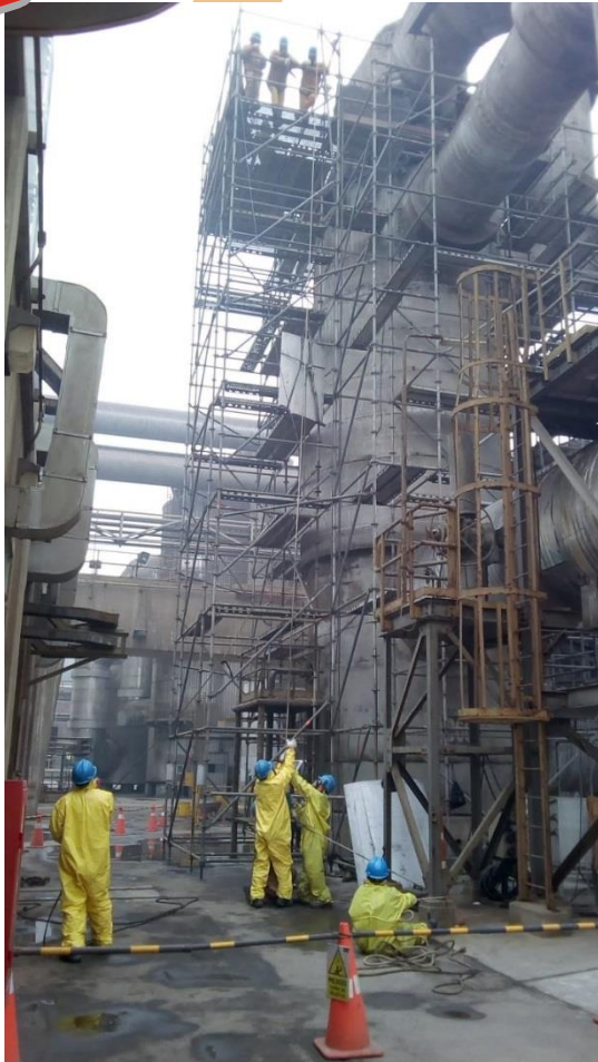
Montaje de andamios