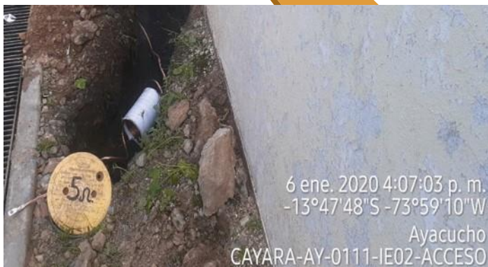
6 ene. 2020 4:07:03 p. m. -13°47'48"S -73°59'10"W Ayacucho CAYARA-AY-0111-IE02-ACCESO

Instalación, mantenimiento de equipos de telecomunicaciones y de seguridad en nodos e instituciones beneficiarias