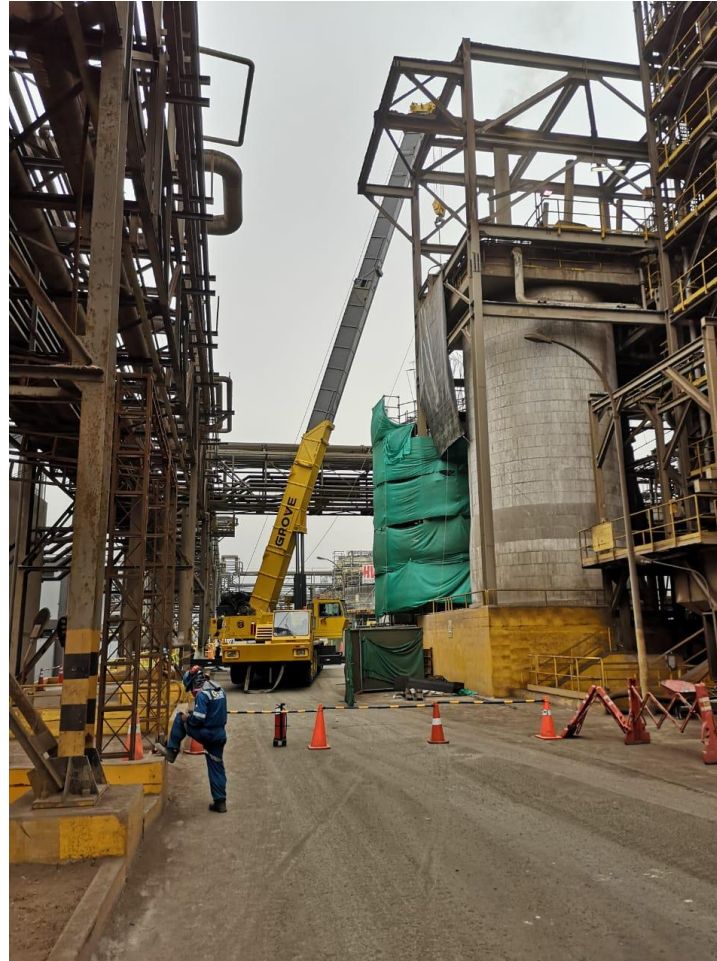
Maniobras de izaje y montaje de equipos