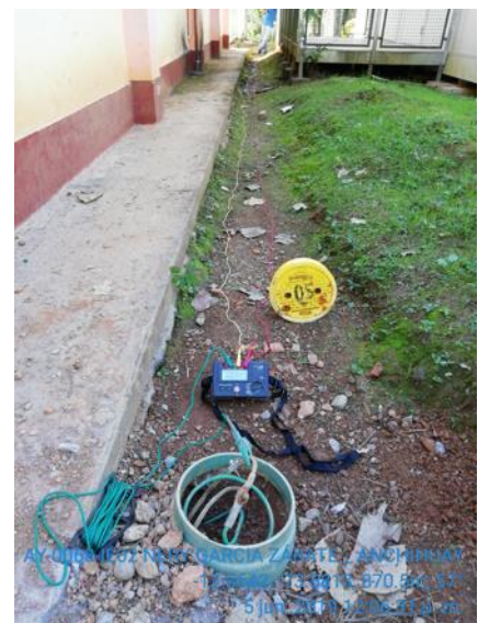
5 jul. 2019 12:05:11 a. m. -13°47'48"S -73°59'10"W Ayacucho CAYARA-AY-0111-IE02-ACCESO