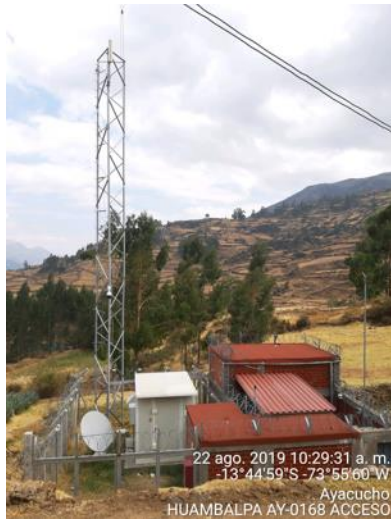
29 jul. 2019 12:53:56 p. m. 13°31'58.367"S -73°52'26.789"W Ayacucho Nodo Concepción AY-0095 Transporte