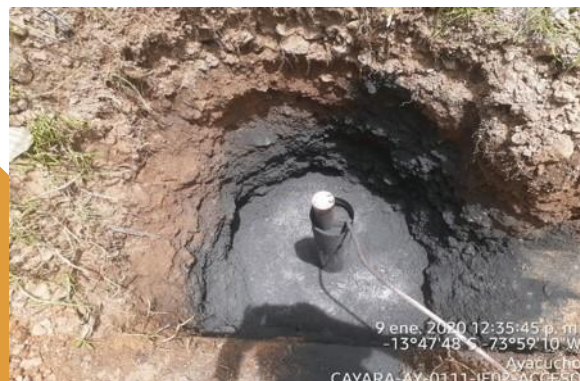
9 ene. 2020 12:35:45 p. m. -13°47'48"S -73°59'10"W Ayacucho CAYARA-AY-0111-IE02-ACCESO