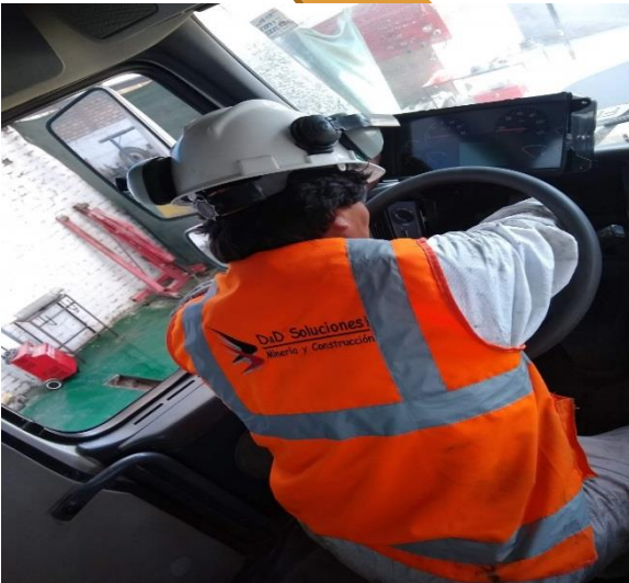
Reparación de tableros eléctricos de equipos.