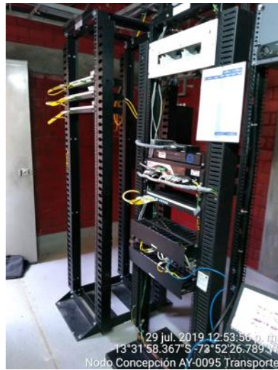
10 sep. 2019 11:07:22 a. m. -12°51'44.69543"S -73°34'56.43887"W Ayacucho Anchihuay AY-0063-IE03 Acceso