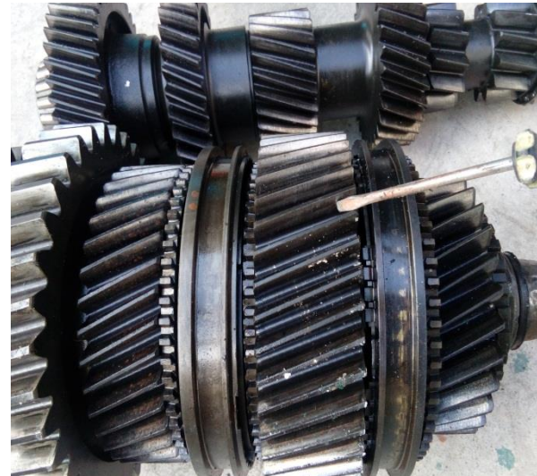
Evaluación y mantenimiento de cajas de engranajes