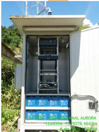
22 ago. 2019 10:29:31 a. m. -13°44'59"S -73°59'60"W Ayacucho HUAMBALPA AY-0168 ACCESO