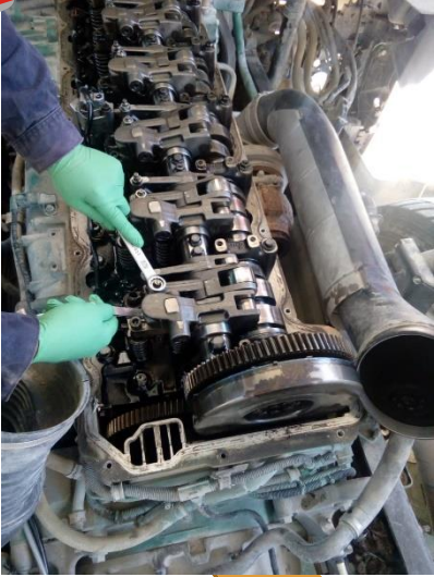
Evaluación y reparación integral de motores de combustión