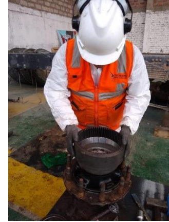
Mantenimiento y reparación de Sistemas de frenos y dirección